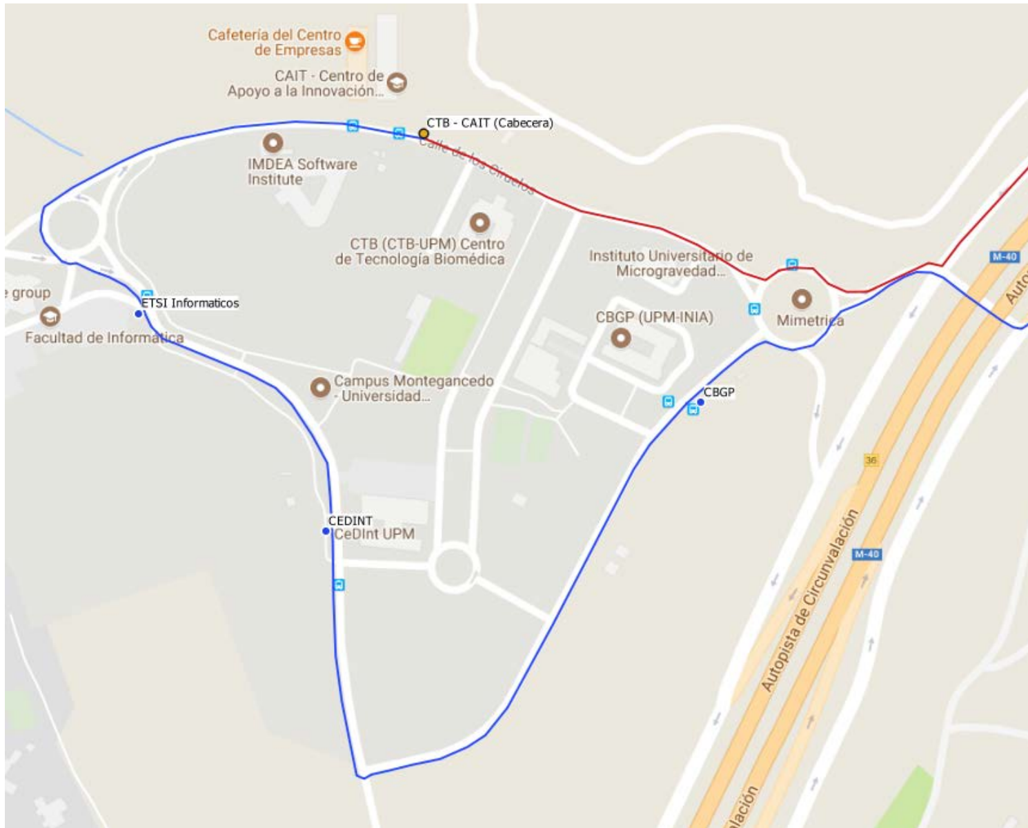
Lanzadera UPM a Montegancedo. 12/01/18