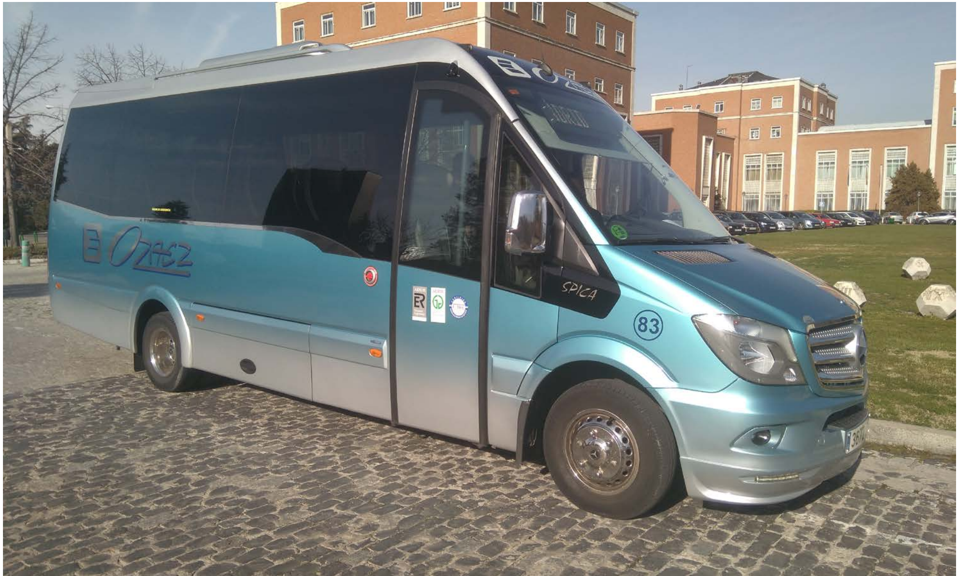
Lanzadera UPM a Montegancedo. 12/01/18